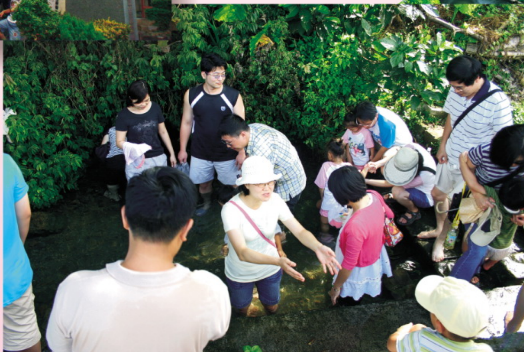
“湧泉老樹區” 湧泉終年不竭， 泉水冰涼清澈、 水質甜美