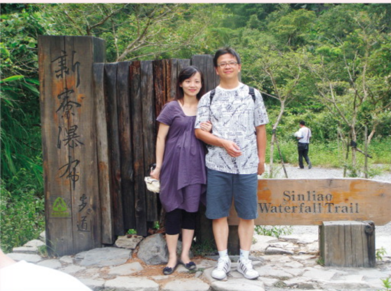
新寮瀑布—冬山河的源頭高250公尺，氣勢非凡。

沿途林相豐富、綠樹成蔭、清風徐來、流水潺潺，步道總長900公尺，約三十分鐘腳程，大夥迫不及待在溪邊與小孩戲水為樂。