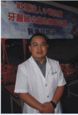
◀ 98.10.10攝於蘆竹鄉南崁國小