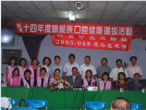
▲ 本會裁判醫師與中區扶輪社指導委員合影