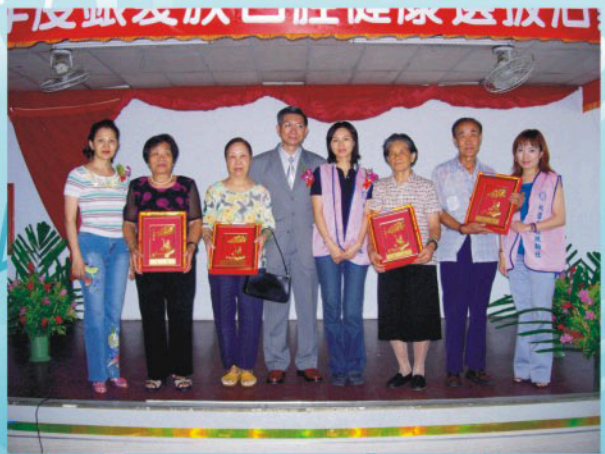
▲ 比賽結果得獎者與本會前王理事長、中區扶輪社社長合影