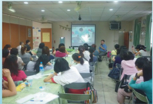
99.06.25於私立仁友愛心家園舉辦身心障礙者口腔保健研討會-身障機構經驗分享