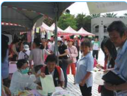
「桃園縣衛生局口腔癌篩檢義診」活動剪輯