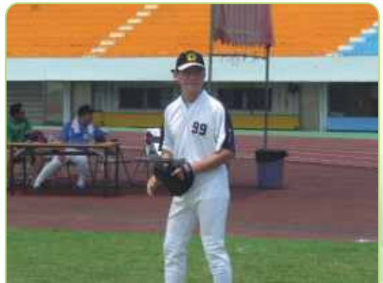
平時打小球，現在打大球反而打不到