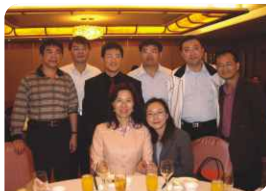
■ 第19屆2次會員大會及北牙保交接