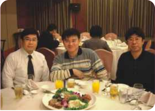
■ 第19屆2次會員大會及北牙保交接