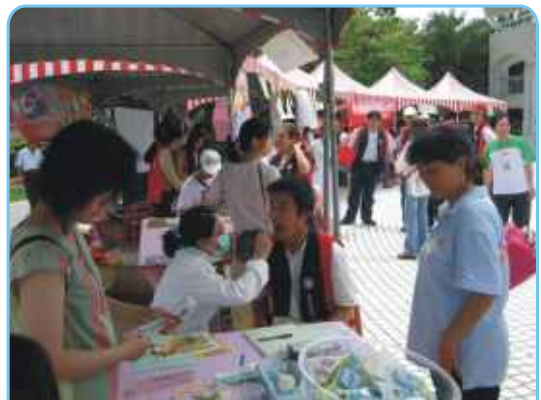
「桃園縣衛生局口腔癌篩檢義診」活動剪輯