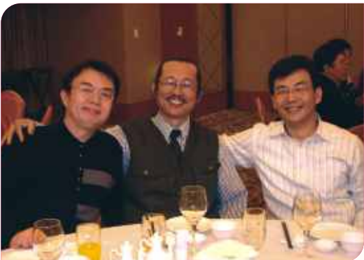
■ 第19屆2次會員大會及北牙保交接