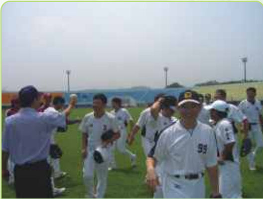
與苗縣牙醫先禮後兵