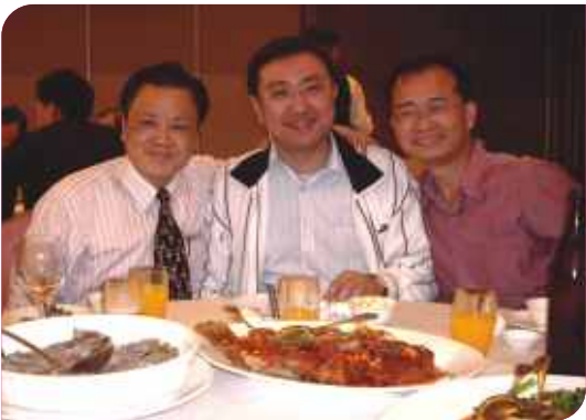
■ 第19屆2次會員大會及北牙保交接