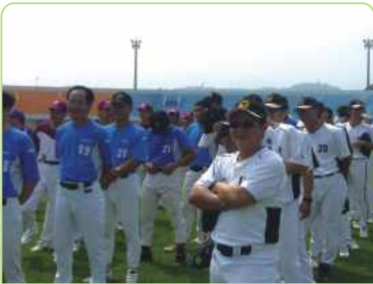
桃園牙醫的主戰將們