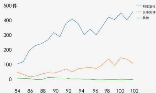
醫療糾紛訴訟性質統計